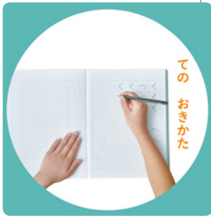
国語の教科書 1年上 P17