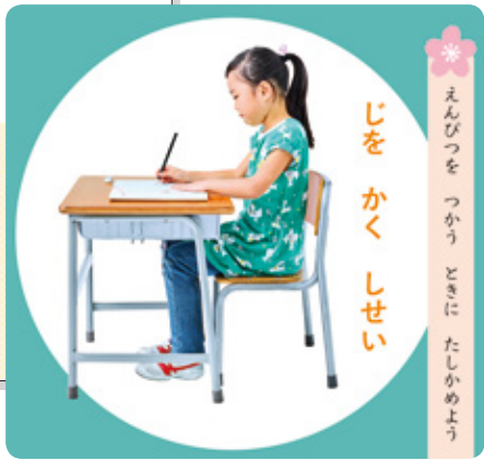
国語の教科書 1年上 P16

全ての学習の基盤となる書くときの姿勢や筆記具の持ち方については、 スタートカリキュラムに効果的に組み込める ように、国語の教科書と同じ写真を使用しています。国語・書写どちらの時間でも指導ができます。また、書き文字も同一執筆者によるもので、 字形の差異による混乱が起らないよう配慮 しています。