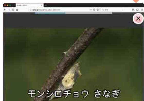
▲上 ポケットずかん：モンシロチョウの動画

保護者の皆様へ「ポケットずかん」に掲載されている動植物の写真や動画がインターネットで見られます。