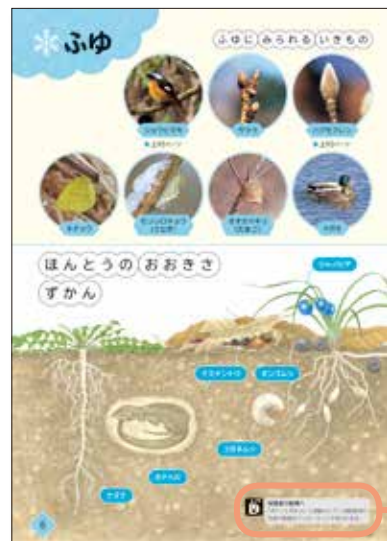
▲上巻末 ポケットずかん®