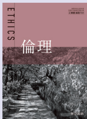
2 東書 倫理701