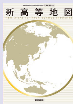
2 東書 地図701