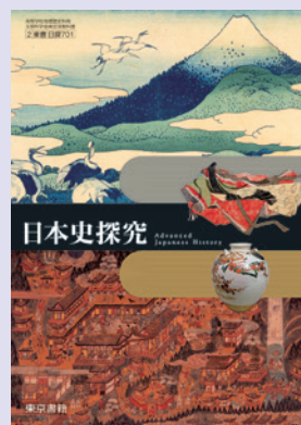
2 東書 日探701