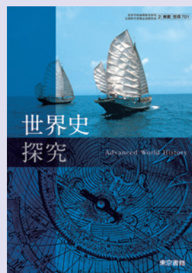
2 東書 世探701