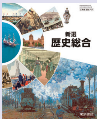
2 東書 歴総701