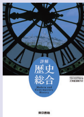
2 東書 歴総702