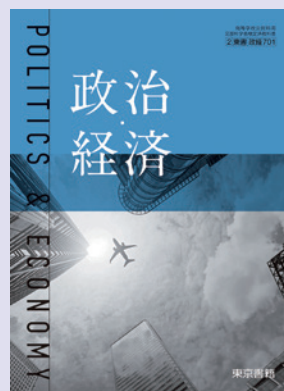
2 東書 政経701