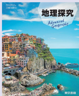
2 東書 地探701