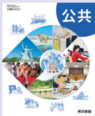
2 東書 公共701