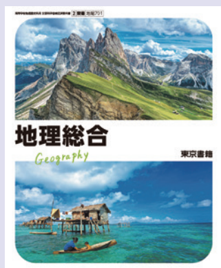
2 東書 地総701

このたびは弊社教科書をご採用いただき、ありがとうございました。より効果的に ご指導いただけますように教師用指導資料をご用意いたしました。ご検討のほど、 よろしくお願い申し上げます。