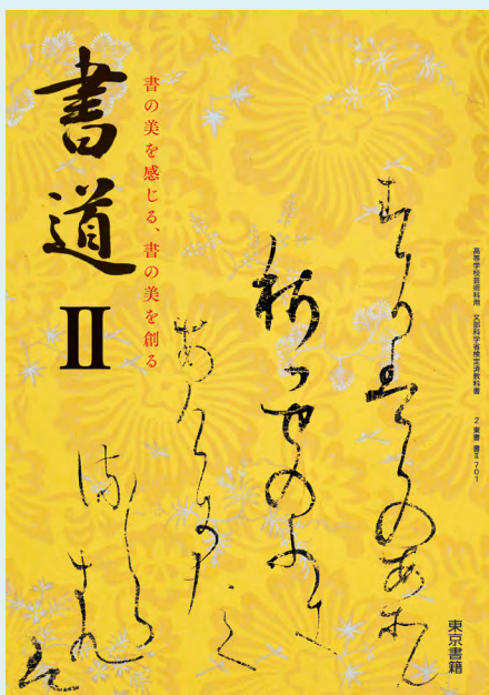
2 東書 書II 701