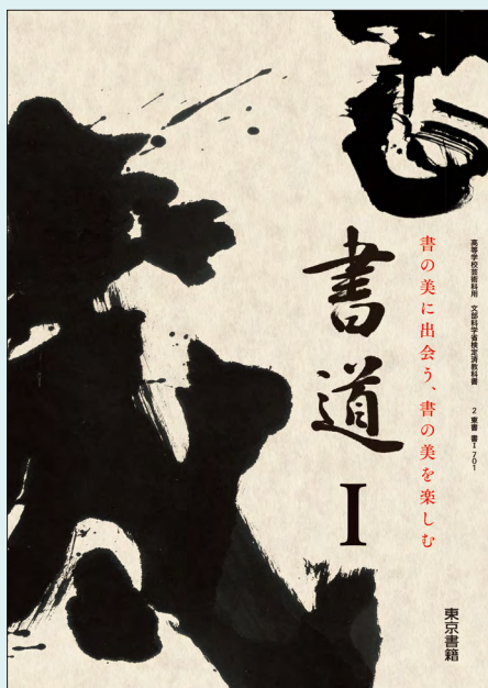
2 東書 書I 701

このたびは弊社教科書をご採用いただき、ありがとうございました。より効果的にご指導いただけますように教師用指導資料をご用意いたしました。ご検討のほど、よろしくお願い申し上げます。