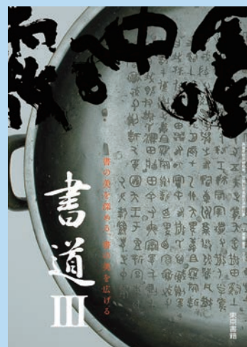
2 東書 書Ⅲ 701