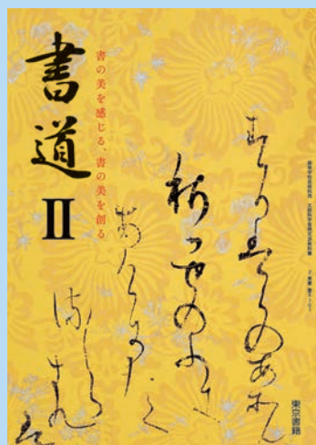
2 東書 書Ⅱ 701