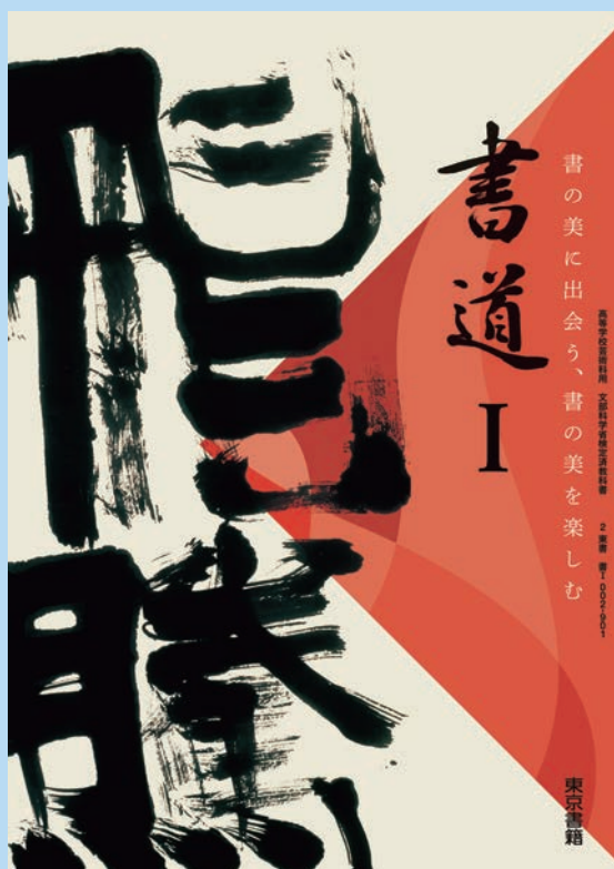
2 東書 書Ⅰ 002-901