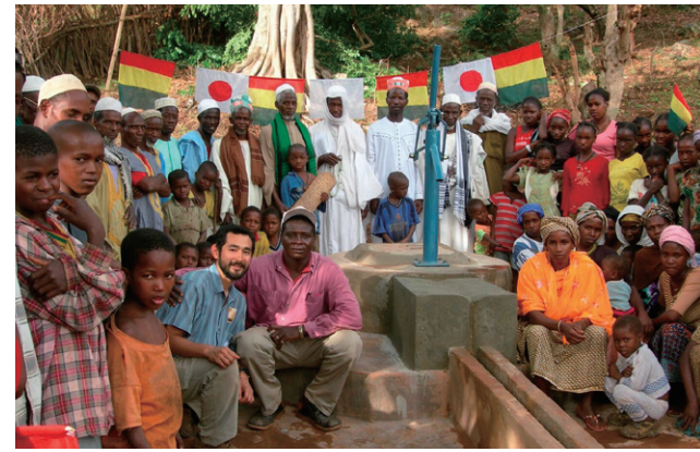
3年p.86～「恩返しの井戸を掘る」