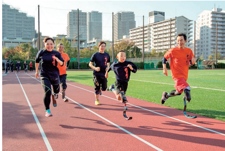
1年p.172～「風を受けて走れ」