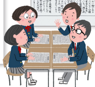
3年p.75～ 「編集して伝えよう」