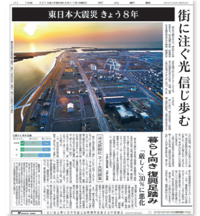
3年p.184～「いつものように新聞が届いた——メディアと東日本大震災」