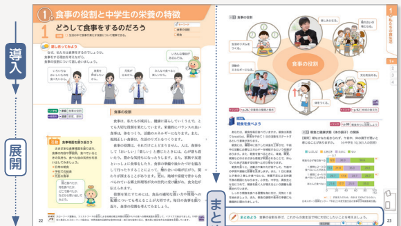
▲ p.22-23 節の基本構成