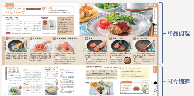
▲ p.74-75 ハンバーグ