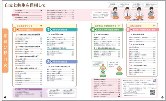
▲ 口絵①-② 目次