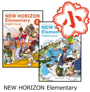
NEW HORIZON Elementary

1年の夏休み前までの期間は、小学校で学んだ内容を中学校の学習につなげることに特化した構成になっています。