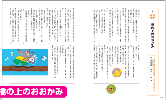
橋の上のおおかみ

小学校低学年の道徳教科書で取り上げられている教材「橋の上のおおかみ」を、1年生の付録に掲載しています。小学校の頃を感じたり考えたりしたことと比べると、新しい発見があるはずです。