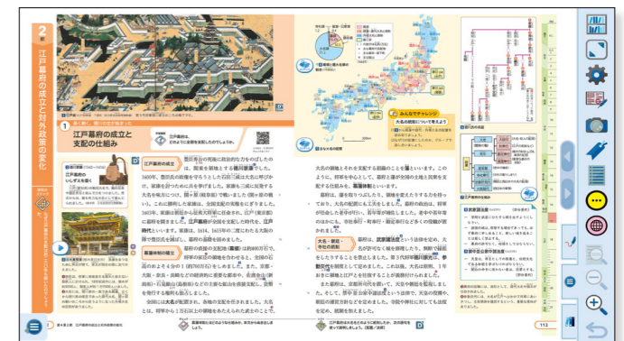
▲ 指導者用デジタル教科書(教材)の画面イメージ