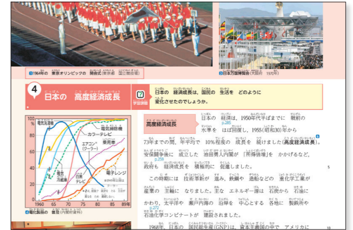
▲ 総ルビ・分かち書きの教科書紙面(令和3年度 中学校「新しい社会 歴史」)

※Google、Google Workspace for Education は、Google LLC の商標です。 ※Microsoft、Microsoft Teams は、マイクロソフトグループ企業の商標です。