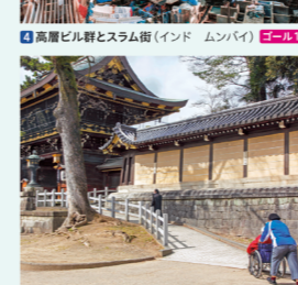
4 高層ビル群とスラム街 (インド ムンバイ) ゴール10 5 神社のバリアフリー設備 (京都府 北野天満宮) ゴール11