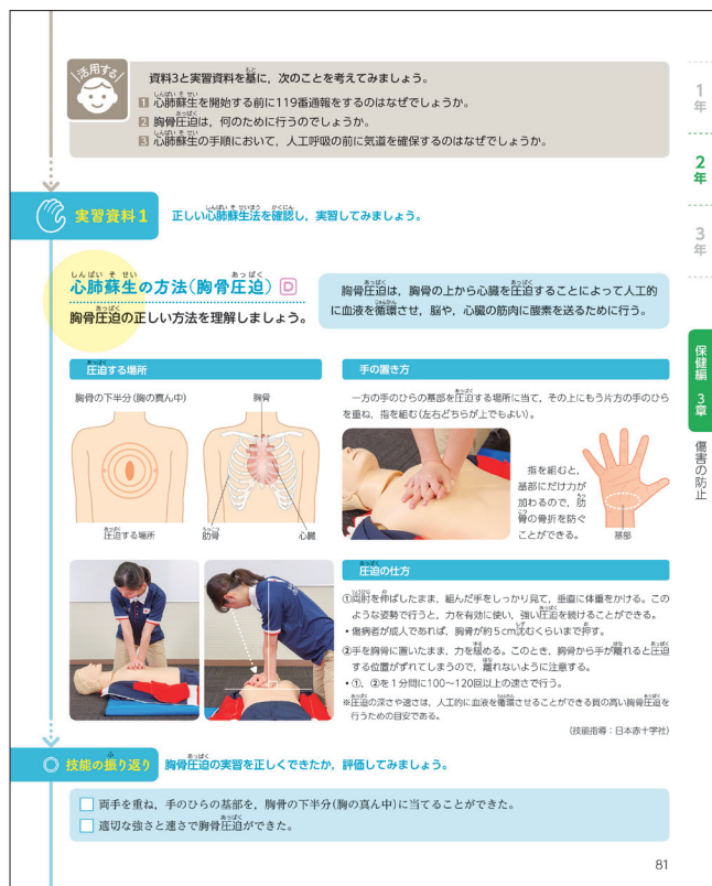
▲p.81 保健編3章「心肺蘇生の方法(胸骨圧迫)」