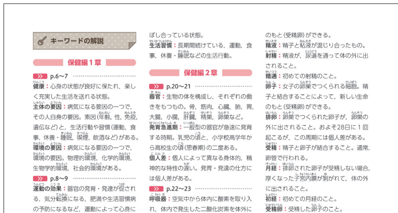
▲p.180「キーワードの解説」

1見開き(1単位時間)の学習のキーワードを示し、巻末にそれら全ての解説を掲載しました。キーワードに着目して学習を進める、キーワードを使って今日の学習をまとめるなど、さまざまな使い方をすることができます。