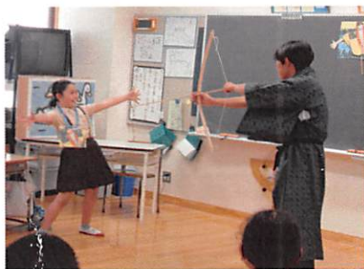
動作化して心情に迫った場面