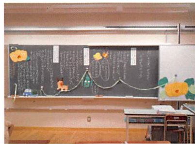
黒板シアターを利用した板書