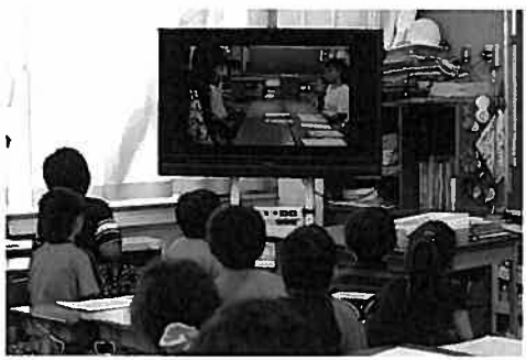
・モデルは学年の先生です。

芝原小オリジナルビデオを製作し、 話し合いのしかたのモデルビデオを 子どもに見せました。