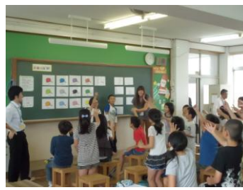
(英語・外国語活動の様子)