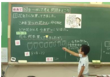
(算数科の学習の様子)