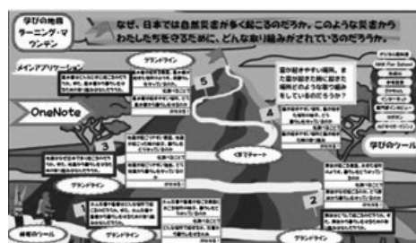
図2 児童が作ったラーニング・マウンテン

①「ラーニング・マウンテン」 (→後期①) 単元導入時に、どのように単元を貫く大きな課題の解決に迫るか、グループで協議し学習計画表「ラーニング・マウンテン」を作成した。