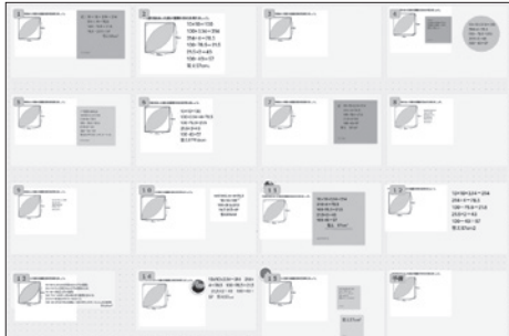
図2 Figmaを使ったプロセスの共有

が含まれている。他者の完成した式を見て「なぜこの友人はこの補助線を引いたのか？」とプロセスを遡って解釈する姿である。自分と他者の考えの間に「差（情報の非対称性）」があることを認識したとき、児童の中に「知りたい」という能動的な問いが生まれる。この非対称性を埋めようとするプロセスこそが、深い学びの正体である。