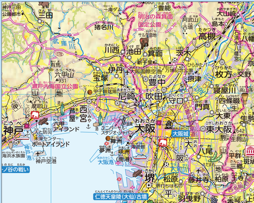
P.33~34 大阪府とそのまわり

(部分・原寸大) 多くの都市が集まっている地域です。文字を大きく、また必要に応じて白い縁取りを付けるなどして、読み取りやすい工夫を施しています。