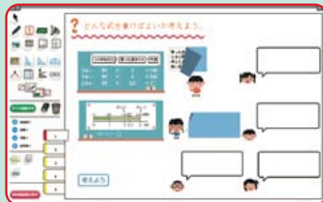
MY教科書エディタの活用事例