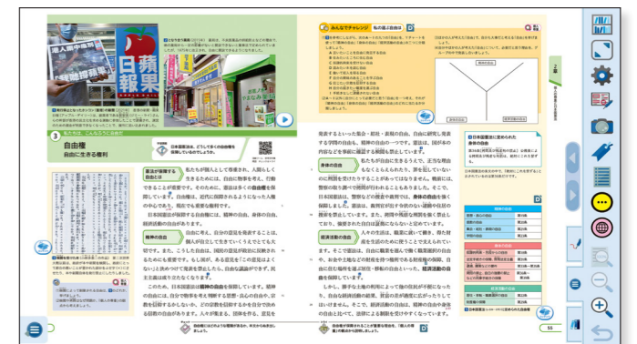
▲ 指導者用デジタル教科書(教材)の画面イメージ